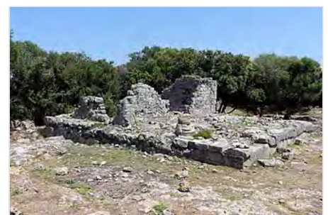
Tempio della triade capitolina

Il Capitolium è il punto di arrivo della via processionale P. Del tempio rimangono ancora resti notevoli soprattutto per la loro conservazione in elevato (fino a 9 m di altezza). La struttura, delle dimensioni di 20,7 x 25,9 m, fu eretta circa nel 150 a.C. su una terrazza con paramento in opera poligonale ; l’accesso avveniva tramite una gradinata tufacea che conduceva sul podio, al pronaos . Il podio, in questo caso, è solo apparente, poiché in realtà le pietre sono solo addossate alle pareti esterne del tempio. Le celle erano tre e il colonnato sulla fronte prevedeva una prima fila di quattro colonne e una seconda fila di due comprese tra le ante. È stato ipotizzato che il colonnato arrivasse a sfiorare i 7 m di altezza, su un totale di 18 m dell’intera costruzione. La presenza di tre celle è la ragione che ha indotto ad ipotizzare il culto alla triade capitolina . Il pronao, molto profondo, presenta una particolarità: davanti alle celle è una cisterna lunga e profonda con i lati brevi stondati. Sulla terrazza, di fronte al tempio, era l’altare, che tuttavia non presentava lo stesso orientamento dell’edificio sacro. Una modifica dell’orientamento in linea con la struttura del Capitolium avverrà solo in seguito, nel