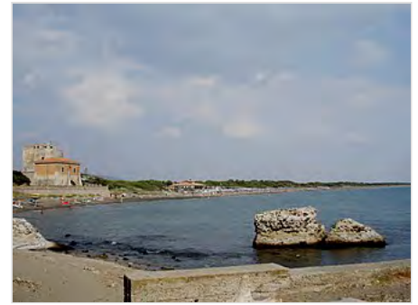
Panorama con Torre della Tagliata dal Porto di Cosa

La retrostante laguna in questo periodo fu dotata di infrastrutture come canali di ricircolo delle acque, fra cui il maggiore è il canale della Tagliata, che permetteva il controllo del flusso dell'acqua e la creazione di vasche per la cattura del pesce. Il porto era, al contrario della città, ricco di sorgenti di acqua dolce sfruttate mediante la costruzione della Spring House , edificio da cui proviene parte di un macchinario ligneo per il prelievo dell'acqua e l'immissione nell'acquedotto. A partire dall'epoca imperiale, il porto di Cosa subì una sensibile contrazione: le cause possono rintracciarsi nell'insabbiamento e nella diminuzione degli scambi commerciali, visto lo spostamento dell'attenzione di Roma sui traffici orientali. Un'ipotesi è quella che la fabbrica dei Sesti sia stata distrutta a seguito dell'appoggio del proprietario alla causa dei Cesaricidi . Durante il I d.C. si impiantò nel sito una villa marittima – la Villa della Tagliata – e sulla Spring House risorse un edificio per la captazione delle acque, probabilmente per rifornire degli impianti termali. La nuova Spring House fu distrutta da un incendio intorno al 150 d.C. La villa marittima, a pianta rettangolare, aveva un accesso monumentale, una torre ed un complesso termale. Completata a metà del secondo d.C. all'interno di un progetto di volontà imperiale, doveva unire le funzioni residenziali a quelle portuali e produttive. La villa, quasi per niente indagata, giace al di sotto di