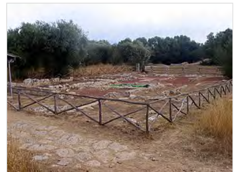
Casa di Diana