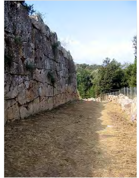
Le Mura di Cosa

che aderiscono perfettamente senza dover ricorrere a leganti. La stessa tecnica si osserva per le mura di Orbetello . Lungo le mura vi sono diciotto torri, poste ad intervalli irregolari, delle quali diciassette a base quadrata e una di forma circolare, in prossimità di Porta Romana. La tecnica costruttiva impiegata per le torri quadrate è la stessa riscontrata per le mura, mentre è differente per la torre circolare, dove è stato fatto uso di malta di allettamento. Vi sono tre porte di ingresso alla città, posizionate in relazione alla viabilità interna ed esterna: la Porta Nord-Ovest (Porta Fiorentina, attuale ingresso al sito), la Porta Nord-Est (Porta Romana) e la Porta a Sud-Est (Porta Marina). Le porte condividono la stessa struttura a propylon , un sistema doppio di chiusura con vano interno; l'uso di saracinesche è documentato dai solchi ancora ben visibili lungo gli stipiti di Porta Romana. L'ingresso all'Arce, invece, avveniva tramite un varco non fortificato tra le mura a delimitazione di quest'area. All'angolo occidentale dell'Arce si apriva anche una postierla, poi tamponata in età altomedievale con scarichi di materiale antico.