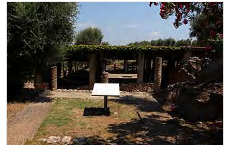
Casa dello Scheletro