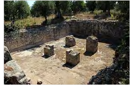
Resti dell'impianto termale

imperiale, in particolare con la rinascita augustea, e tra l'età traianea e quella antonina. Le terme, cui si accedeva dalla strada O, erano alimentate dal sistema di cisterne della colonia, sfruttando anche la naturale pendenza del terreno da Sud a Nord; rappresentano dunque una grande prova ingegneristica. La maggior parte dell'acqua arrivava attraverso un cunicolo che collegava le terme alla cisterna pubblica del Foro. La struttura più imponente è certamente l'alto muro in opus incertum che sorregge una vasca a pianta rettangolare rivestita di cocciopesto; è ancora oggetto di studio il sistema di sollevamento dell'acqua fino a questa vasca. Gli ambienti indagati sono interpretabili secondo lo schema romano del frigidarium , tepidarium e calidarium , e i locali annessi come latrine, spogliatoi e palestre. L'acqua era riscaldata nel praefurnium e trasportata nell' alveus (una piscina) e nel laconicum (sauna) da un sistema di tubuli . Non lontano dalla vasca sopraelevata vi è un ambiente circolare in opus latericium , interpretato come laconicum (sauna) sulla base di quello che sembra un ipocausto rivestito superiormente da un pavimento mosaicato.