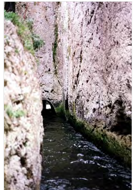
La tagliata etrusca