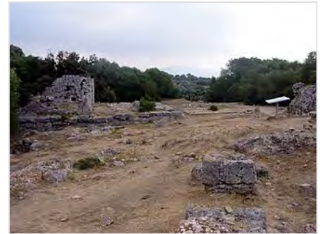
Resti del tempio di Mater Matuta

I resti del piccolo edificio sacro sono ancora ben visibili. Conosciuto come Tempio D, è stato interpretato come sede del culto di Mater Matuta , ma la sua posizione “marginale” sull’Arce ne denota un ruolo secondario. La struttura, datata al 170-160 a.C., s’imposta su un basso podio in opera poligonale ed in origine era dotata di un’unica cella quadrata di 9 x 9 m con quattro colonne di ordine tuscanico . L’accesso avveniva tramite una gradinata di fronte al tempio, dove era anche l’altare, di cui rimangono le sole fondamenta. Un’ingente ristrutturazione avvenne presumibilmente all’inizio del I secolo a.C., quando la decorazione fu rinnovata e quattro nuove colonne furono erette in posizione avanzata rispetto alle preesistenti. Furono costruite, inoltre, due ante a prosecuzione dei muri laterali della cella, fino ad inglobare le due colonne esterne originarie, mentre quelle centrali furono smantellate. Queste operazioni furono condotte contemporaneamente alla costruzione del Capitolium .