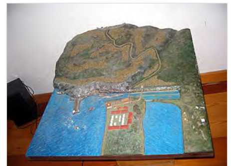
Ricostruzione del Portus Cosanus