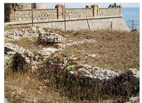
I resti Villa Romana della Tagliata

La retrostante laguna in questo periodo fu dotata di infrastrutture come canali di ricircolo delle acque, fra cui il maggiore è il canale della Tagliata, che permetteva il controllo del flusso dell'acqua e la creazione di vasche per la cattura del pesce. Il porto era, al contrario della città, ricco di sorgenti di acqua dolce sfruttate mediante la costruzione della Spring House , edificio da cui proviene parte di un macchinario ligneo per il prelievo dell'acqua e l'immissione nell'acquedotto. A partire dall'epoca imperiale, il porto di Cosa subì una sensibile contrazione: le cause possono rintracciarsi nell'insabbiamento e nella diminuzione degli scambi commerciali, visto lo spostamento dell'attenzione di Roma sui traffici orientali. Un'ipotesi è quella che la fabbrica dei Sesti sia stata distrutta a seguito dell'appoggio del proprietario alla causa dei Cesaricidi . Durante il I d.C. si impiantò nel sito una villa marittima – la Villa della Tagliata – e sulla Spring House risorse un edificio per la captazione delle acque, probabilmente per rifornire degli impianti termali. La nuova Spring House fu distrutta da un incendio intorno al 150 d.C. La villa marittima, a pianta rettangolare, aveva un accesso monumentale, una torre ed un complesso termale. Completata a metà del secondo d.C. all'interno di un progetto di volontà imperiale, doveva unire le funzioni residenziali a quelle portuali e produttive. La villa, quasi per niente indagata, giace al di sotto di