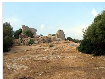
Via Sacra verso l'Acropoli

All'inizio del III secolo d.C., sotto la dinastia severiana , la città mostrò una ripresa. L'istituzione della Res Publica Cosanorum , la cui identificazione con la città di Cosa è ancora discussa, testimonia la volontà di risollevarne le sorti del centro e del suo territorio, l' Ager Cosanus . Nuovamente abbandonata alla fine del III secolo, per il IV secolo d.C. a Cosa si documentano minime tracce di occupazione e segni di negligenza pubblica. Anche il porto vide la cessazione dei lavori di manutenzione. Una sorta di cesura si delineò tra Cosa romana, oramai decaduta nel III secolo, e Ansedonia bizantina, risorta dalle ceneri della prima alla fine del V secolo d.C. Il racconto di Rutilio Namaziano (Rut. Namaz., De Reditu Suo , 1.285-290) ci offre un'immagine di Cosa composta solo da antiche rovine deserte, menzionando la leggenda del suo abbandono a causa di un'invasione di topi.